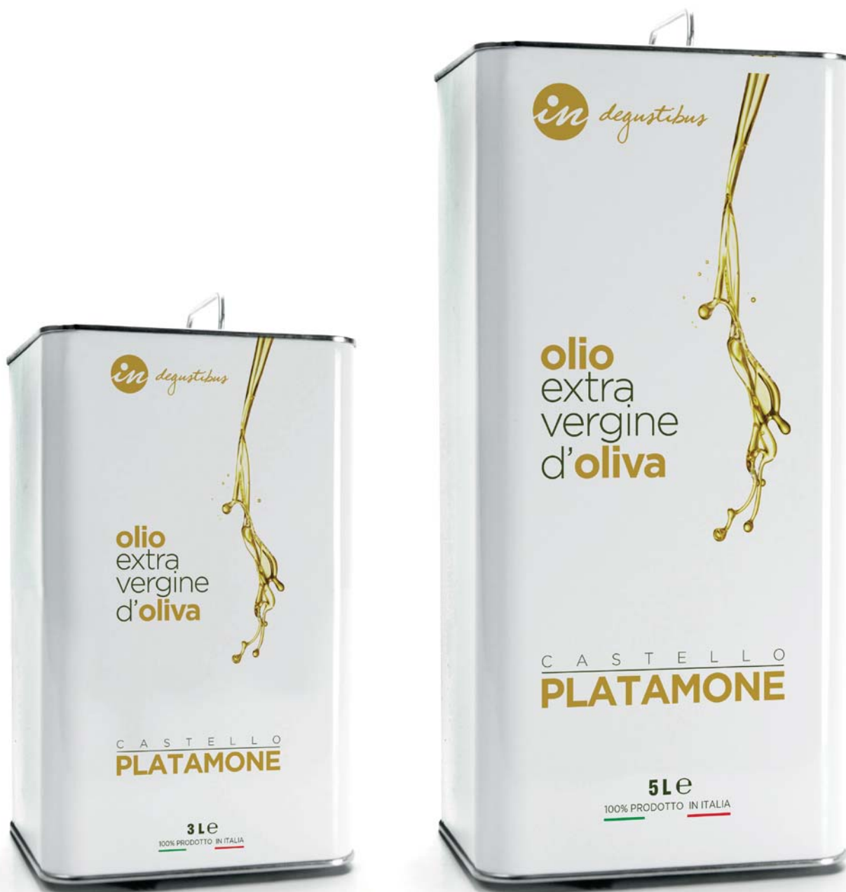
Latta 3 L / 101,44 FL OZ